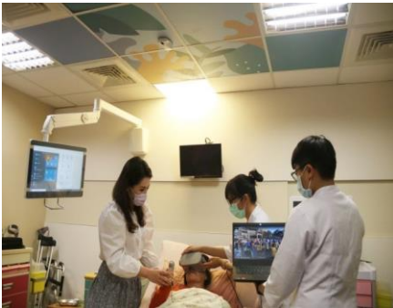
護理系 OSCE 教室智慧科技情境教學