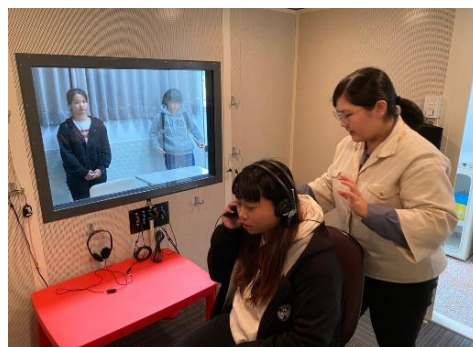
聽力師執行聽力檢查