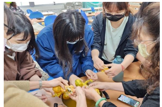
業界參訪、研習-實務了解與體驗 (薑黃於活動相關運用)