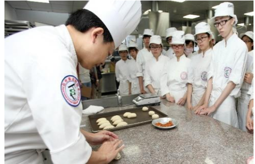
烘焙專業強化：課程教學