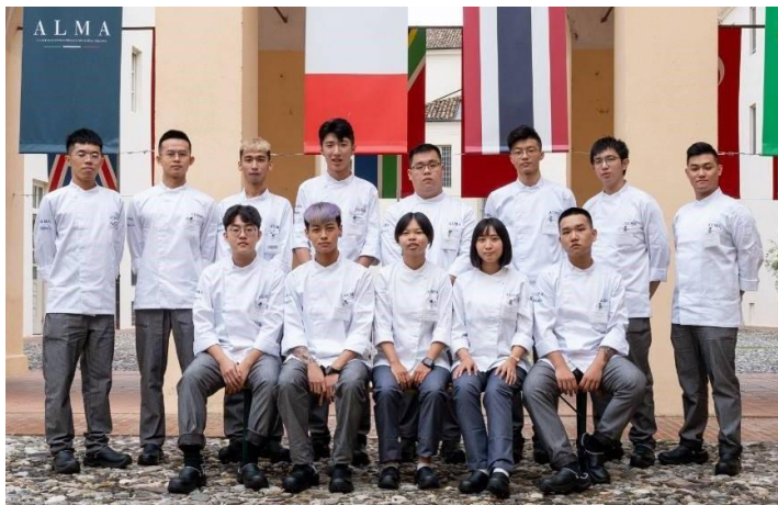
學生至義大利 ALMA 廚藝學院實習