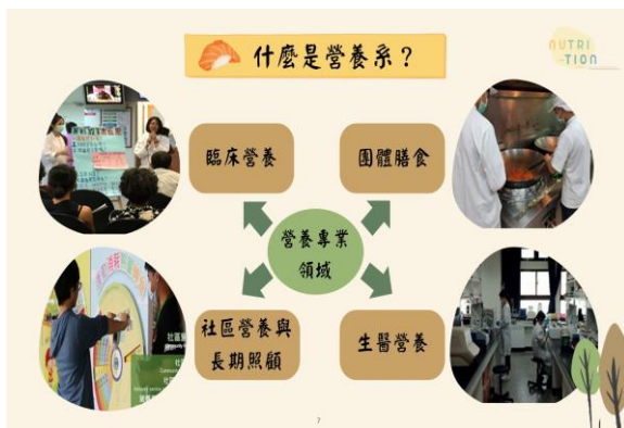
營養系培養四大領域人才

營養系以培育營養專業領域人才為主軸，除致力營養師專業之臨床營養、團體膳食、社區營養與長期照顧及生醫營養之人才養成外，亦依未來社會發展，提供營養保健相關的專業人才培育。學生將來可依據修課狀況，報考營養師、餐飲採購與供應管理師、食品技師、食品檢驗分析師、保健食品初級工程技師等專業證照。本系教師具臨床或產業實務經驗及產學合作開發能力，可提供學生多元學習資源。