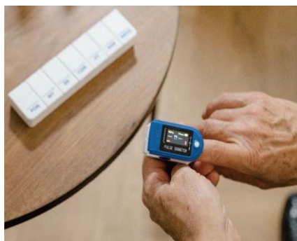
醫材企劃與應用實務