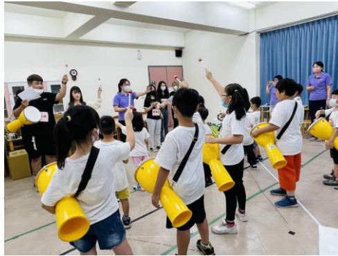
指導幼兒音樂活動療育身心靈