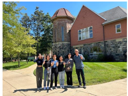
護理系學生於美國 EMU 大學修習雙聯學位