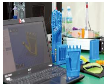
輔具設計與智能控制