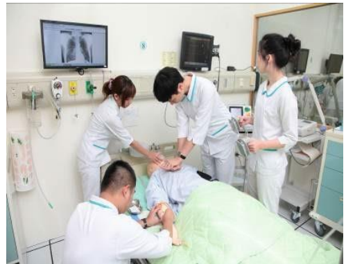
護理系高擬真教室授課現況