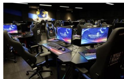
電競暨多媒體遊戲發展實驗室