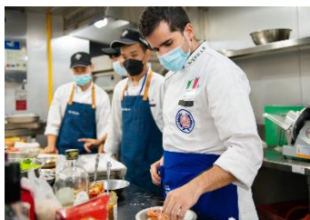
義大利籍師資授課