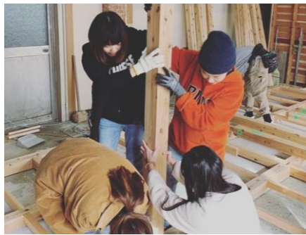
美國紐約、日本大野場域實作