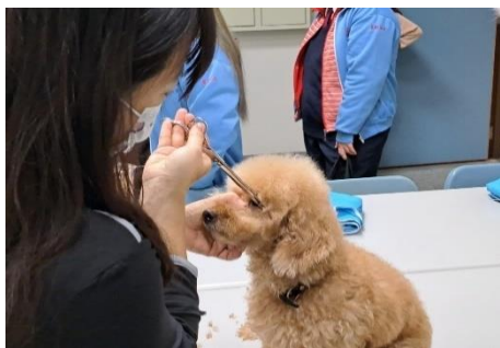
寵物美容技術操作