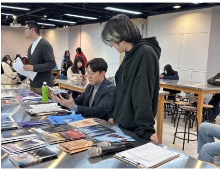
小班教學互動討論

本系之課程規劃與實習皆結合文創產業之公、民營單位約九十家，使學生得以文化環境之薰陶，具備生活美學之藝術涵養，配合創意設計之概念與語彙，做整合性之規劃與行銷。本系每年邀請海外專家學者與藝術家、策展人蒞校短期授課。亦安排學生至加拿大、澳洲、日本、泰國、馬來西亞等國家進行「海外實習」強化學生實務能力，並赴世界頂尖學校紐約 Parsons 設計學院進行短期交流。大學四年課程設計導入設計思考與總整問題實作導向兼顧創新設計與品牌營造，以培養學生就業能力。