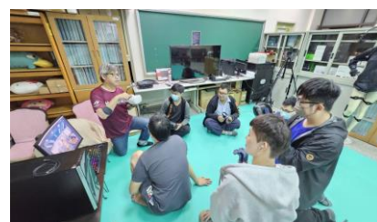
多媒體 VR 體驗