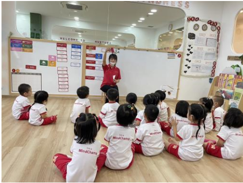
強化學生國際移動力，並幫助應屆畢業生能有海外就業成功之機會

本校除經營三所非營利幼兒園外，並承接臺中市、彰化縣、托育服務中心、托嬰中心等機構，協助學生達到學用合一之目標。近年新加坡、美國等地學前教育華文師資需求殷切，本系已與新加坡許多優質幼教機構合作，進行學術交流、師資培訓，強化學生國際移動力。