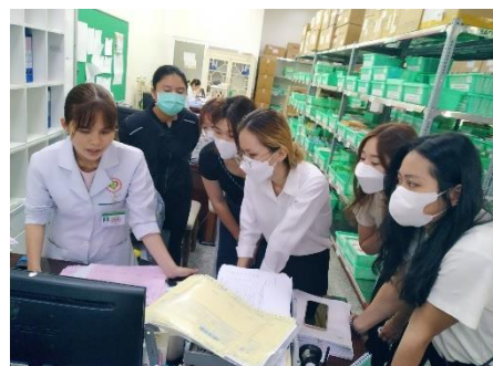
培育健康產業之管理人才