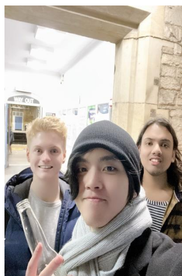
英國坎布里亞大學 國際商務雙聯學位