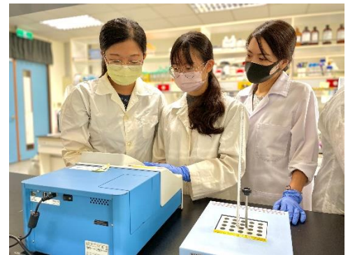
腫瘤營養研究室-實驗情形