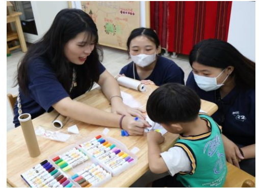
發揮幼保專業陪伴偏鄉部落幼兒製作萬花筒