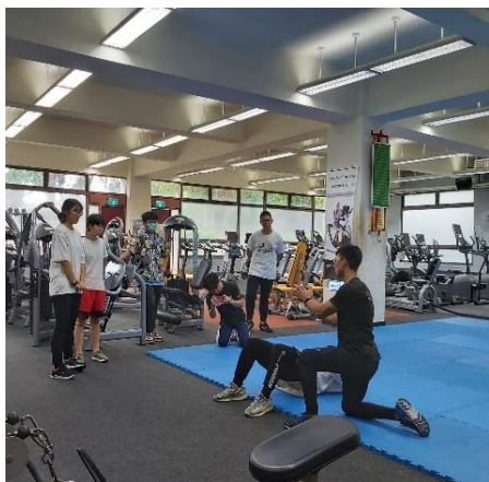
健身產業研習上課情形