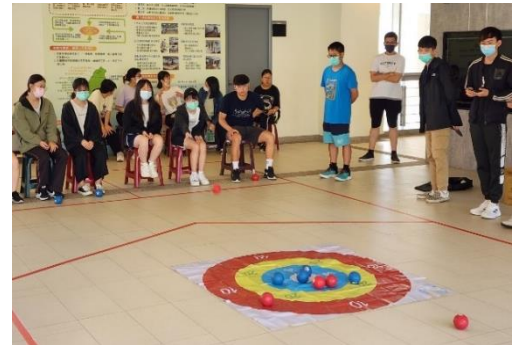
證照輔導班-樂齡地板滾球運動指導員