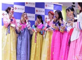
韓國首爾女子大學交換