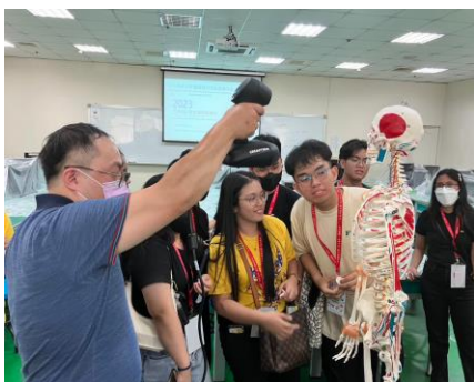
智慧醫材設計與製造

醫療產業擔任醫療器材研發、產品製程自動化工程師或醫療院所擔任醫學工程師，或報考醫材、資電、電機、機械等相關研究所進修深造。