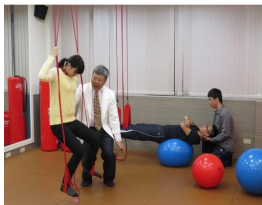
物理治療是將運動指導融入治療處方

1. 物理治療師是人體動作醫學的專家，目的為促進人類健康和功能的專業，範圍涵蓋預防醫學、臨床治療醫學、復健醫學和安寧緩和醫學四大領域。「物理治療師」一直是最佳職業排行的熱門專業，也是最不易被 AI 取代的專業，醫療產業外，也是運動健促與長期照護產業不可或缺的專業人員。