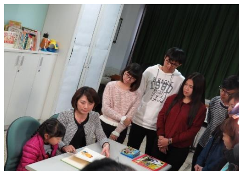
語言治療師執行兒童語言治療