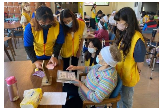
專業應用-至長照機構為長者進行化妝療法