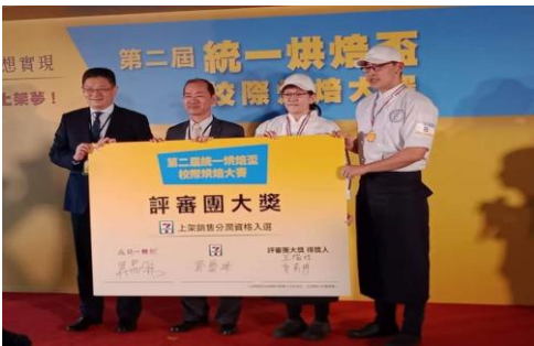
食品科技技藝肯定：統一烘焙盃校際烘焙大賽連續 2 年榮獲評審團大獎