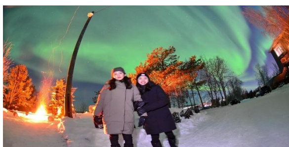
本系學生赴加拿大 Humber College 交換 (攝於黃刀鎮極光園)

近五年獲教育部補助薦送學生赴美、英、加、日、韓、俄及澳洲等國家進行交換學生及雙聯學位達五十件，並與加拿大 Humber College 簽訂師生互訪交流協議，以深耕學生跨文化認知與視野。