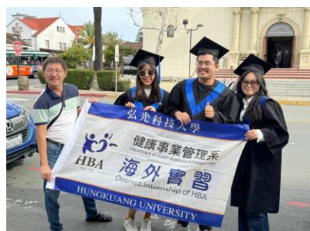
海外實習-拓展國際產業實務經驗