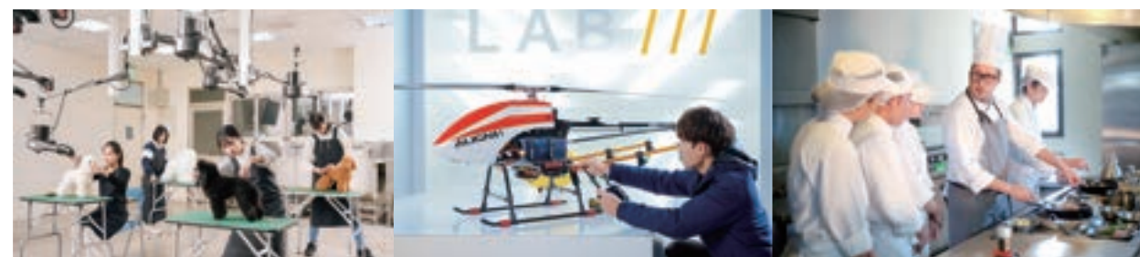
寵物美容專業教室