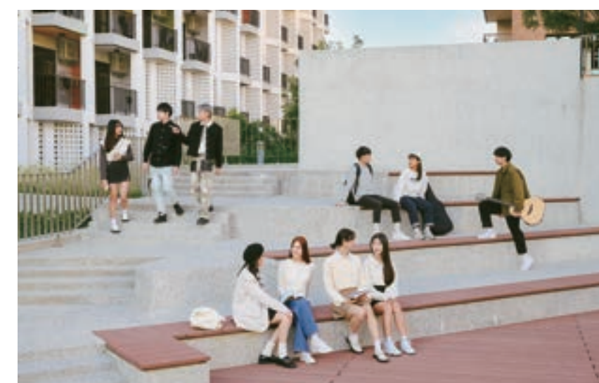
學生宿舍戶外廣場