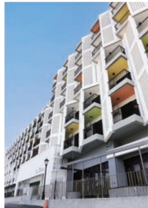
打造良好的校園生活機能