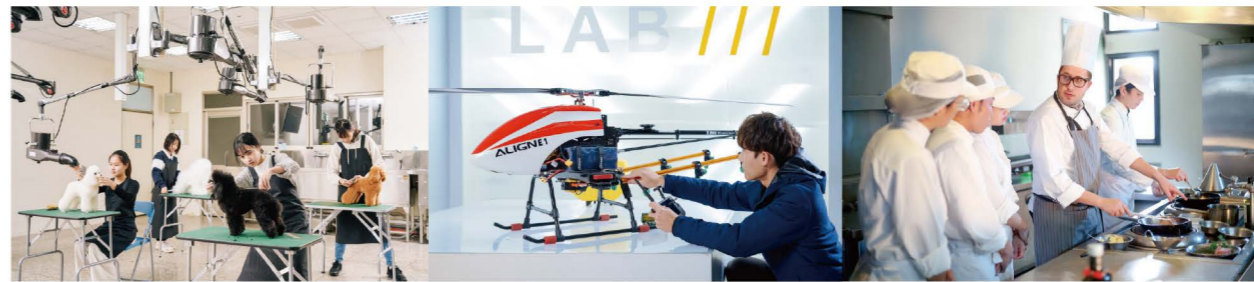
寵物美容專業教室

分別設有「護理學院」、「醫療健康學院」、「民生創新學院」、「國際餐旅學院」、「智慧科技學院」共五大學院，21個專業系科，7個研究所，1個博士班。