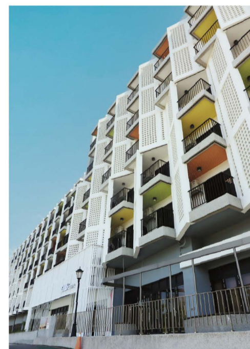
打造良好的校園生活機能

距臺鐵沙鹿站車程約 10 分鐘 至高鐵臺中站車程約 25 分鐘 近國道 3 號交流道及臺中國際機場