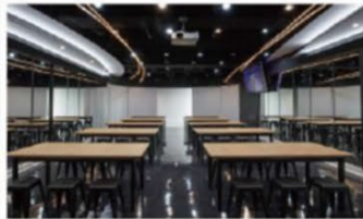
● 整體造型展演製作教室 - 1