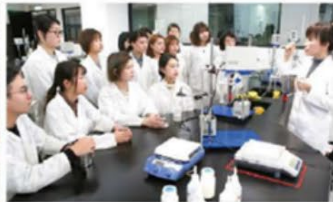
● 資源再生產品開發實作教室