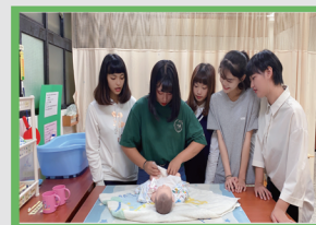
專業證照檢定輔導