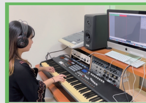
教學設備實用多元