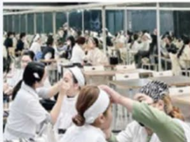
● 造型設計應用實作課程