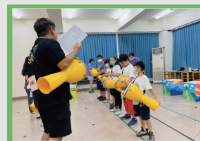
指導幼兒音樂活動療育身心靈