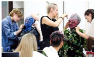
● 英國倫敦時尚學院電影特效妝髮研習課程