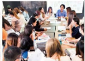
● 應用美學與創意表現