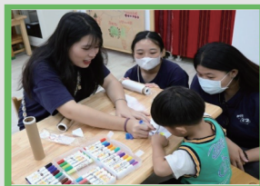
發揮幼保專業陪伴偏鄉部落 幼兒製作萬花筒