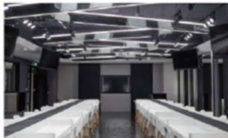
● 時尚美麗菁英實作教室