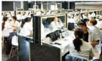
● 時尚美妝專業課程