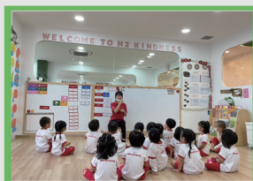
強化學生國際移動力，並幫助應屆畢業生能有海外就業成功之機會

招收大學、專科畢業生及具同等學力者，或高中職畢業且具五年以上相關工作經驗，對兒童保育工作有興趣者。