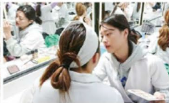
● 主題彩妝設計實作課程