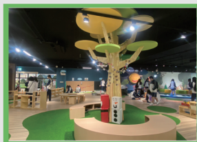
多元兒童教保產業實踐場域