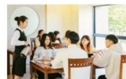
弘樓館 (精緻餐飲、專業服務)