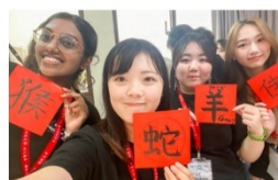
跨國混班、國際交流