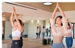
地板教室 (多功能空間)