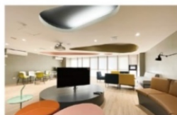
交誼廳 (影音及投影設備)

刷卡管控智慧型生活宿舍，設有智慧超商、健身房、電競室、文書處理站、餐飲 DINING 等。