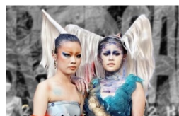
各系展演、走秀活動