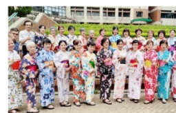
異國文化體驗活動