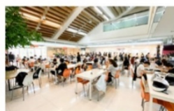
寬敞明亮學生餐廳