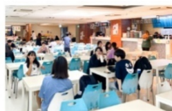
異國美食街 (義/日/韓/泰/越/川菜)

百貨商場級美食街多樣性餐飲選擇，由專業營養師督導餐飲衛生，讓全校師生都能吃得健康。