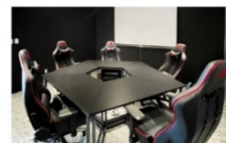
手遊電競室 (影音及投影設備)