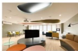
交誼廳 (影音及投影設備)

刷卡管控智慧型生活宿舍，設有智慧超商、健身房、電競室、文書處理站、餐飲 DINING 等。