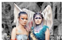
各系展演、走秀活動