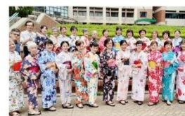
異國文化體驗活動