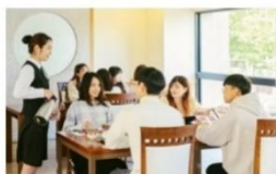
弘樓館 (精緻餐飲、專業服務)