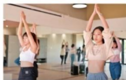
地板教室 (多功能空間)