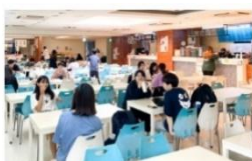
異國美食街 (韓/日/韓/泰/越/川菜)

百貨商場級美食街多樣性餐飲選擇，由專業營養師督導餐飲衛生，讓全校師生都能吃得健康。