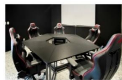
手遊電競室 (影音及投影設備)