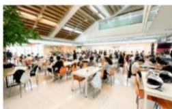
寬敞明亮學生餐廳