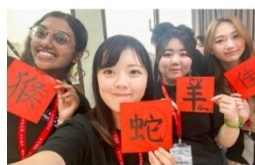
跨國混班、國際交流