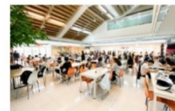
寬敞明亮學生餐廳