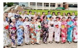
異國文化體驗活動