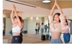
地板教室 (多功能空間)