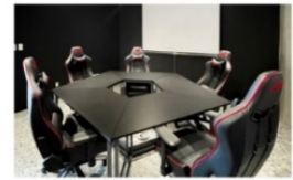
手遊電競室 (影音及投影設備)