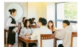
弘樓館 (精緻餐飲、專業服務)