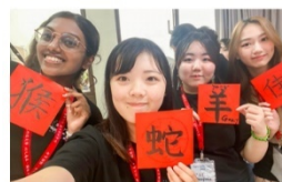
跨國混班、國際交流