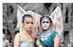
各系展演、走秀活動