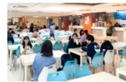
異國美食街 (義/日/韓/泰/越/川菜)

百貨商場級美食街多樣性餐飲選擇，由專業營養師督導餐飲衛生，讓全校師生都能吃得健康。