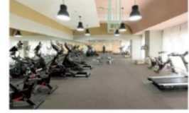
健身房 (智慧型出入管控)