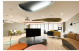
交誼廳 (影音及投影設備)

刷卡管控智慧型生活宿舍，設有智慧超商、健身房、電競室、文書處理站、餐飲 DINING 等。