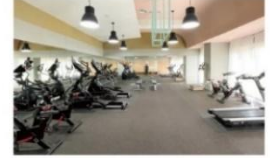
健身房 (智慧型出入管控)