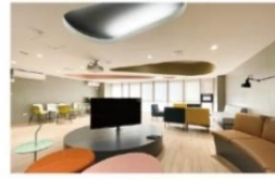
交誼廳 (影音及投影設備)

刷卡管控智慧型生活宿舍，設有智慧超商、健身房、電競室、文書處理站、餐飲 DINING 等。