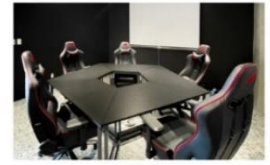
手遊電競室 (影音及投影設備)