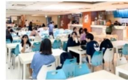
異國美食街 (義/日/韓/泰/越/川菜)

百貨商場級美食街多樣性餐飲選擇，由專業營養師督導餐飲衛生，讓全校師生都能吃得健康。