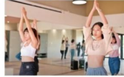
地板教室 (多功能空間)