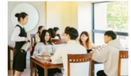
弘樓館 (精緻餐飲、專業服務)