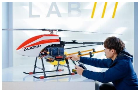
無人機教育與訓練中心

讓你從模擬飛行一路走到真實場域，體驗「無人機+邊緣 AI+雲端平台」的完整整合。