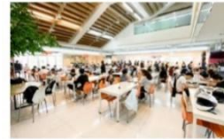
寬敞明亮學生餐廳